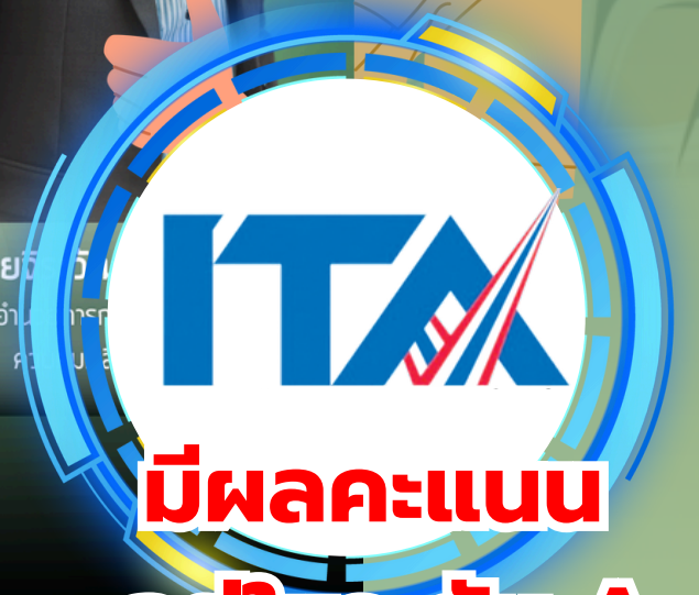
นาย... รองผู้อำนวยการ...