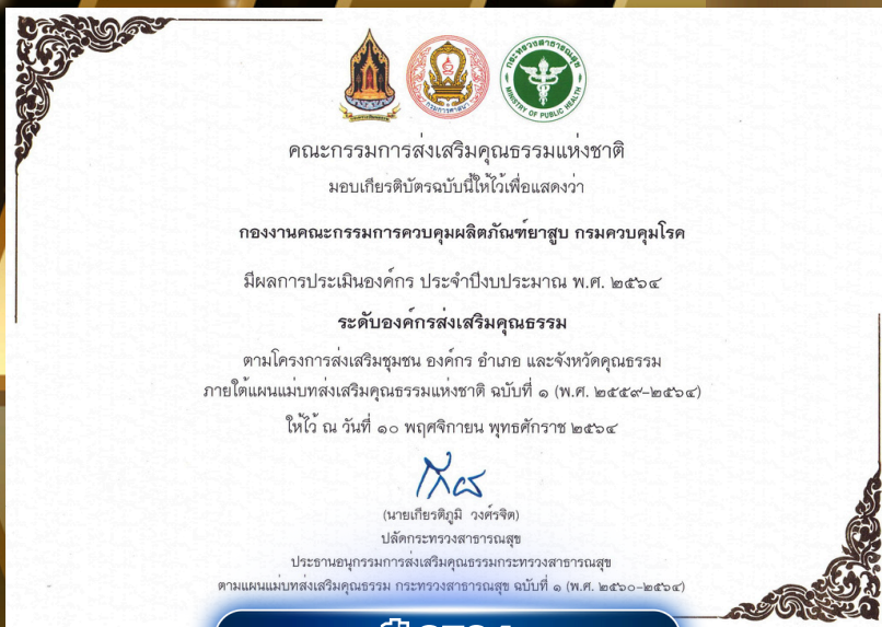
ปี 2564 องค์กรส่งเสริมคุณธรรม