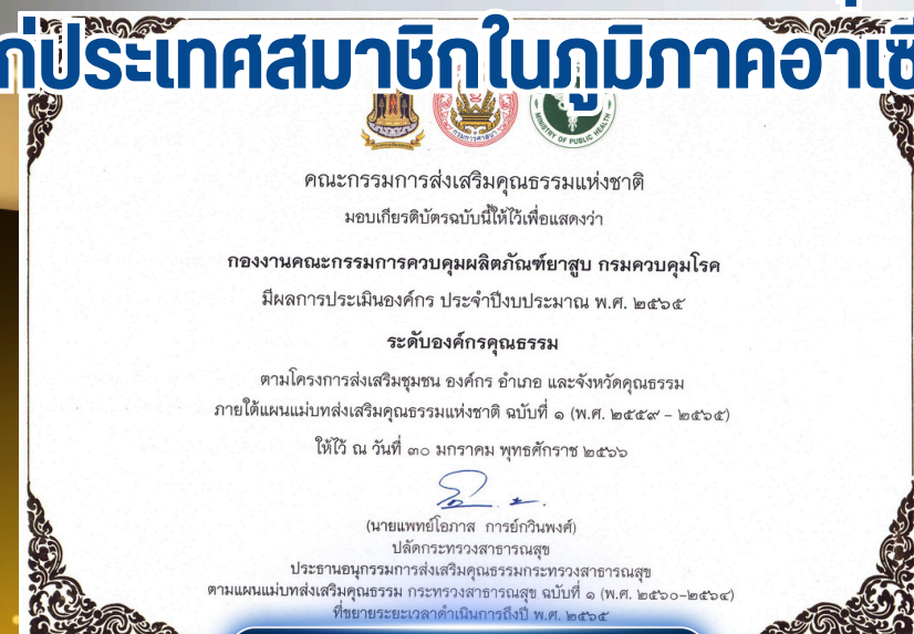
ปี 2565 องค์กรคุณธรรม